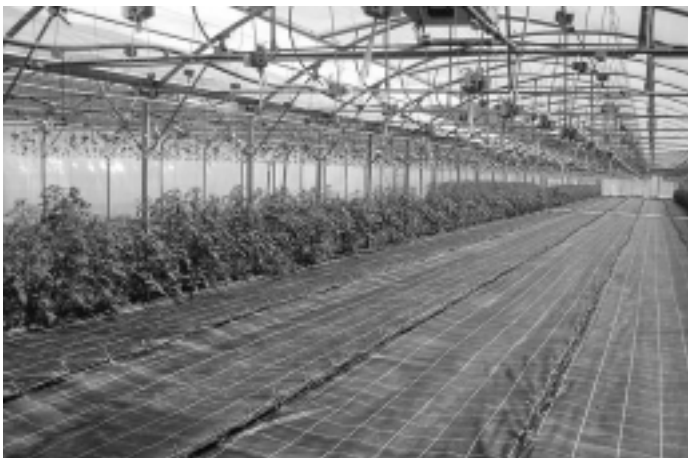
Totalausfall: Normale Tomaten bodeneben abgeschnitten

Phantasia und Philovita. Die normalen Tomaten sind alle so befallen, dass wir sie bodeneben abgeschnitten haben. Wir hoffen, dass sie wieder austreiben! Ein großer auch finanzieller Verlust auf 3000 m 2 Fläche. Alle resistenten Sorten sind nur ganz wenig krank geworden und werden Anfang Juni zu ernten sein.